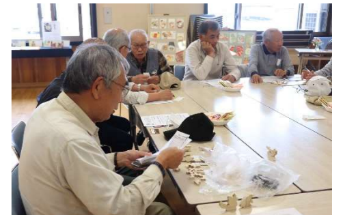
受講生たちによる交流の様子