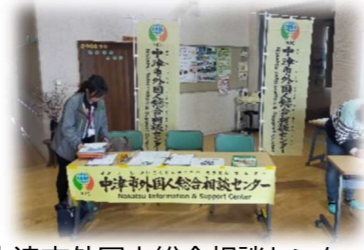
中津市外国人総合相談センターの方も参加しました！