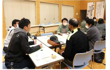
グループでお話している様子

参加者からは、「自分たちが経験した活動以外のボランティア活動を知ることができて勉強になった」「自分ごととして取り組むことが大切」等ご意見をいただき、今後に向けて貴重な意見交換が出来る機会になりました。