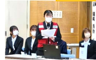
中津北高等学校 きれまち隊の皆さん