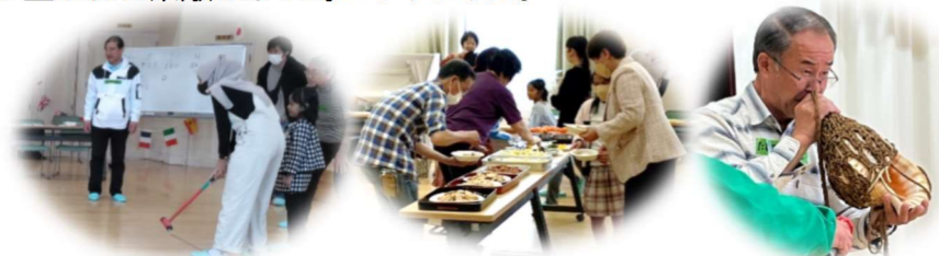
はじめは少し緊張も…その後のゲームや食事でもみんな笑顔に♪

お互いに話をする中で「家が近所だね。困ったら何でも聞いてね。」というやりとりもあり、新しいつながりが生まれる素敵なしと時となりました。