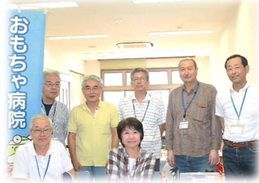
みなさんのご参加をお待ちしています！

現在、「おもちゃ病院やま」の皆さんは第3日曜日にイオンモール三光(偶数月)と中津市教育福祉センター(奇数月)にて定期開院をしています。他にも、様々なイベント・場所で開院しています。ドクターは9名いらっしゃいますが活動が広がり、新しい仲間も増やしていきたいということから養成講座を開催します。