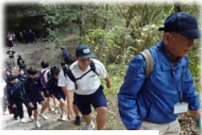
競秀峰を散策しました

「本耶馬溪町観光ボランティアガイドの会」は、町の歴史をまとめる時に「史跡や名所をガイドする団体があってもいいのでは？」と、平成15年に発足しました。現在の会員は8名で、案内するコースが決まっていたら、事前に歩いてみて安全確認をしています。皆さんにやりがいを聞くと、「ガイドは一期一会のお付き合い。全国の方と繋がって、喜んでもらえるのが嬉しい。」とおっしゃっていました。