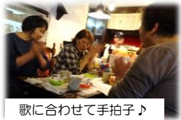
歌に合わせて手拍子♪