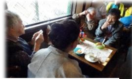
楽しい会話のひとつ

5月21日、音猫にて「オレンジカフェ本耶馬溪」を開催しました。当日は26名が参加し、初めての方や、久しぶりに顔を合わせた方が多く、会場はたくさんの笑い声と和やかな雰囲気であふれていました。