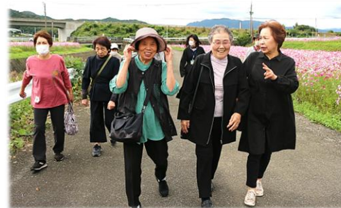
一面に咲き誇るコスモスを鑑賞！

耶馬溪地区の地域課題を探り、解決を目指すことを目的とした「耶馬溪地域福祉ネットワーク会議」が以前、サロンを対象に実施したアンケートをとった際、買い物への困りが挙げられました。課題解消の第一歩として、10月21日（火）、城井地区の若宮サロンより15名の方に参加・ご協力いただき、買い物バスツアーを行いました。行先は、「三光コスモス園」、「道の駅なかつ」、「ゆめタウン中津」。サロンメンバー同士でお食事をしたり、お目当てのものを探して様々なお店を巡ったりと、弾む会話の中、楽しんでいただけた様子でした。