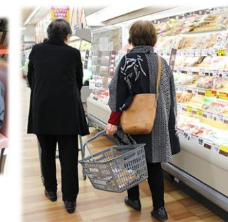
お買い物のようす