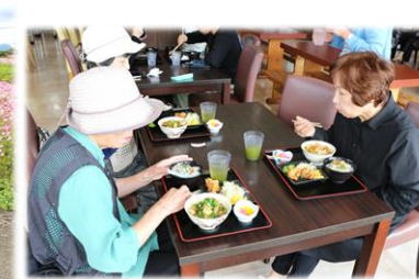
道の駅なかつにて 昼食タイム♪