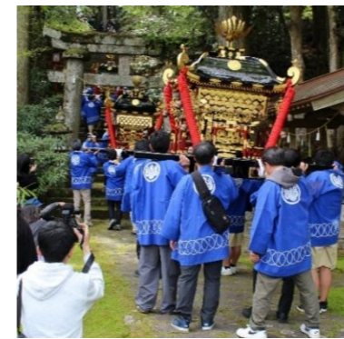
東九州龍谷高校の生徒も、神輿の担ぎ手として参加しています。

ボランティア団体「 檜原山の歴史と自然を守る会 (以下「 守る会 」)」は、「まつやく(演じ手)」の皆さんが観客を巻き込んでユーモアたっぷりに熱演。「神輿かきの人手が足りない」という声を受け、檜原マツの行事を手伝っています。「守る会」は、地域の高齢化・過疎化が進んで集落の方が少なくなり、歴史や文化を次の世代に伝えることが難しくなったことがきっかけで結成されました。故郷への想いをつなげていくことを目的に活動しており、この日は多くの観客で賑わう中、会員の皆さんが行事の進行を見守っていました。