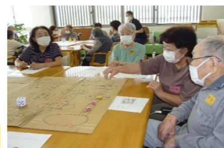
高齢者施設での活動の様子(福祉ボランティアキューピット)