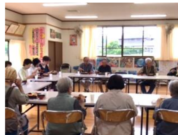
一緒に食事もしました♪