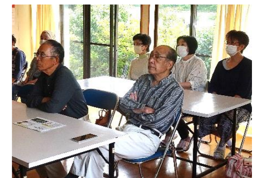
森山サロンの皆さん

最後に、下深水サロンの手作り弁当を森山地区の方々と一緒に食事をされるなど和やかな雰囲気の中、交流会を終えました。