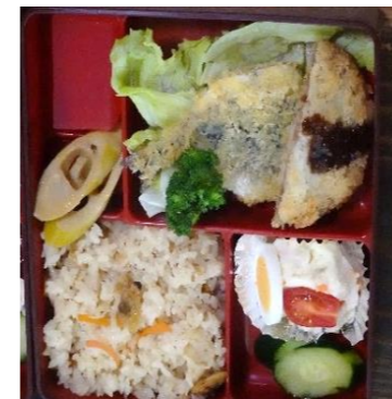
下深水サロンの手作り弁当♪

ここ数年は、異常気象がすすみ毎年どこかで地震や水害などが起きていることを『自分ごと』として受け止め、自分の身を守る備えが大切です。備えができていない地域の復興は著しい傾向にあります。