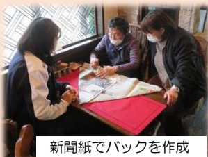
新聞紙でバックを作成

当日は認知症地域支援推進員や包括支援センターの職員もいますので、気軽にご参加いただき、認知症への理解を深めていただける機会となっています。