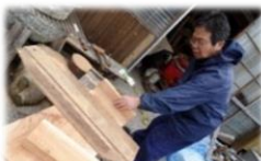
けやきで平台を作成中

62歳まで自動車販売の営業をしていました。退職後、趣味の日曜大工で作業小屋を作ったことが始まりです。