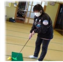
ルーレットゴルフ