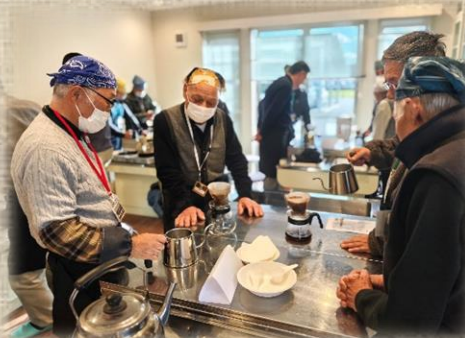
各班で珈琲の淹れ方を実践している様子