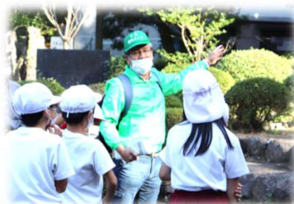
地元小学生に史跡の案内 (三光観光ボランティアガイド)