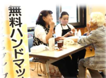
「ほらかふえ」でハンドマッサージ (幸美会)