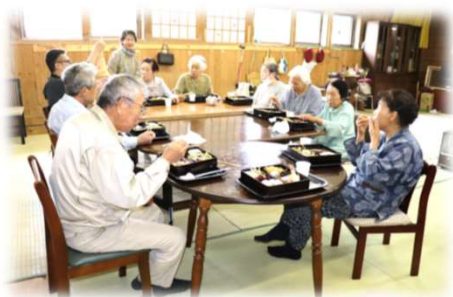
手作り昼食を食べながらおしゃべり (はちどりの会)