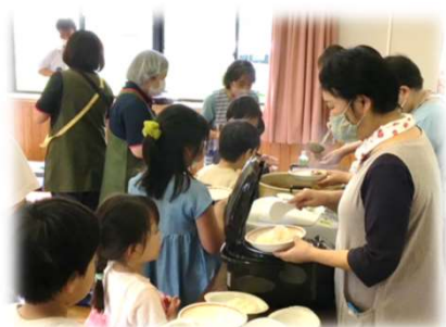
子ども食堂でカレーを提供 (Teamめいぐる)