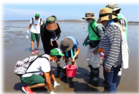
中津干潟で生き物観察 (NPO法人水辺に遊ぶ会)