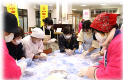
駅構内で餅つき大会 (中津レクリエーション協会)