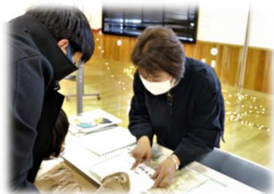
まつりで点字絵本を展示 (絵点楽)