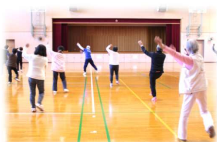
会員みんなで、いい汗かこう！ (中津市運動で健康づくり推進協議会)