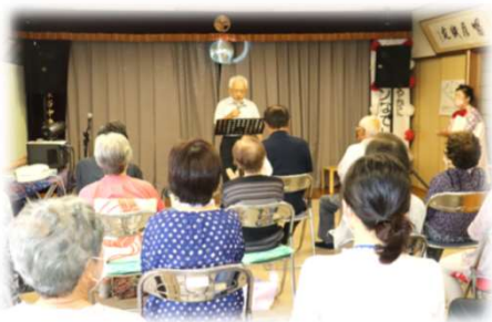
サロンでカラオケ (サロンなでしこ)