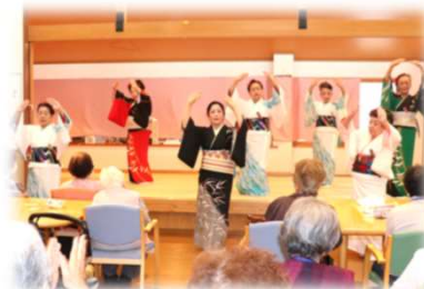
施設で日舞を披露 (様若流扇女の会 佐知踊り愛好会)