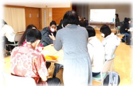
外国人に日本を指導 (日本語教室きらきら)