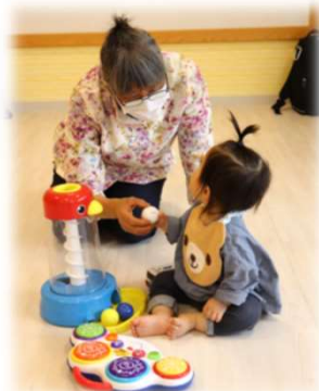
子どもとふれ合い (童心アカデミアおもちゃ図書館)