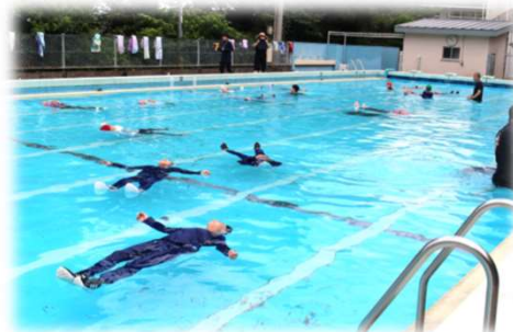
小学校で着衣泳の授業 (大分着衣泳会 中津支部)