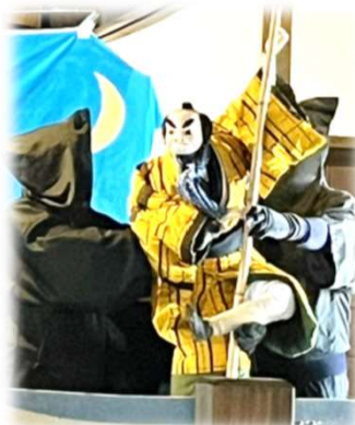
人形芝居を奉納 (北原人形芝居保存会)