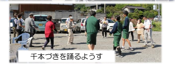
千本づきを踊るようす