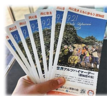
お配りしたパンフレット