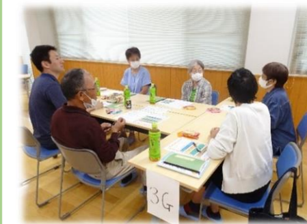
意見交換中の様子