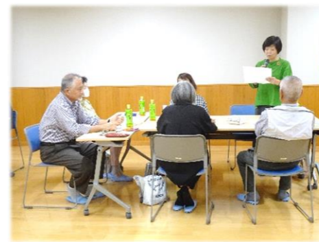
意見交換した内容の発表の様子