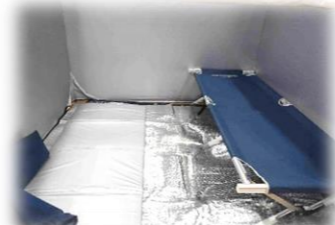
災害時の簡易ベッド