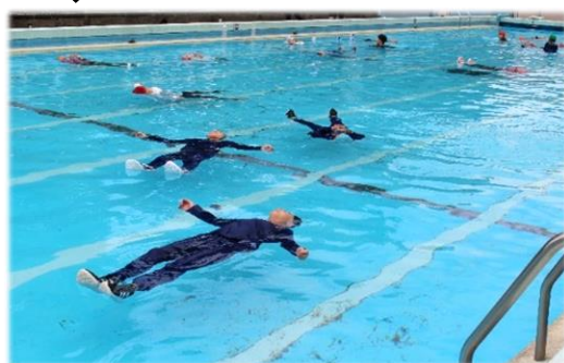
「浮いて待つ」が上手にできました

川や海で溺れた時は「浮いて待て」を覚えた。ランドセルで浮くことは難しいと思ったけど浮けたのですごいと思った。