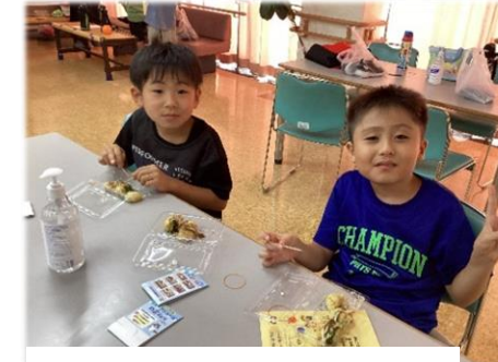
たこ焼き美味しかったよ◎

8月9日(金)に三光コミュニティーセンターにて「三光児童館わいわいまつり」が開催され、約250名の来場があり、縁日コーナーや飲食コーナー、パラスポーツの体験コーナーなどのブースを楽しまれました。当日は「三光地区地域福祉ネットワーク協議会「ふくしの里ややま」」の皆さんや地域の小中学生の皆さんのボランティア協力により、各ブースを盛り上げてくださいました。この場を借りてお礼を申し上げます。