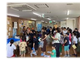
三光児童館夏まつり

子どもから高齢者まで幅広い世代が集まり、イベントを通じて、地域とのつながりを深めます。