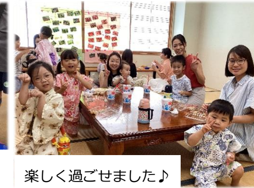
楽しく過ごせました♪