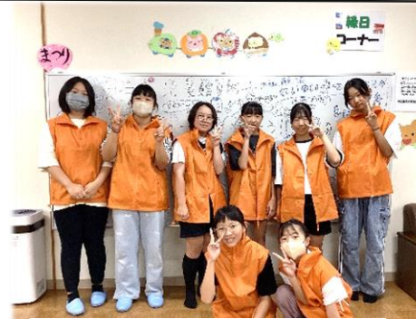
当日協力いただいた中学生