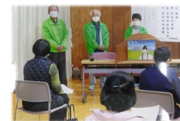
サロンでの紙芝居

こんな紙芝居があります！ 「八面山の名所旧跡」 「戦前、戦後の生活の様子」 「八面山の平和の願いを込めて」