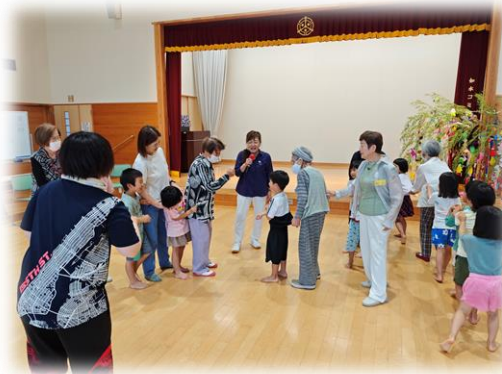
↑手作りコマ回し ←じゃんけん列車 ふれあいレクの様子