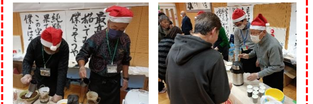
とても丁寧に淹れていただき、来場者の皆さんにも大変好評でした♪

毎年、クリスマスの日の中津市教育福祉センターでカレーをふるまう「まんぶくnicoキッチン」を開催しており、今年は4名の男塾受講生の方に美味しい珈琲を淹れていただきました。ご協力ありがとうございました☆