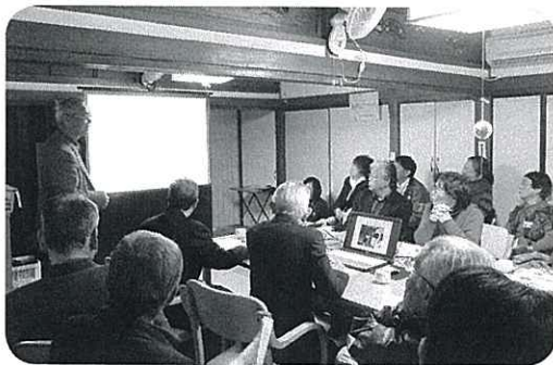
中原たすけあいの会への視察

中津市では今年度より「生活支援・介護予防を考える会」が始まりました。29年度は主に移動・外出支援について意見交換・相互理解を深める機会として、タクシー・バス等の交通機関の方々や民生委員、有償サービス団体、福祉関係者などと、これまでに協議の場を2回設けています。今後の仕組みづくりに向けて高齢者や支援する立場の人が抱えている困りごとを明らかにしていく中で、今回の研修内容を参考にし、中津市におけるより良い形を検討していきたいと考えています。