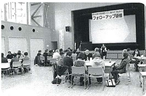
グループワークで交流