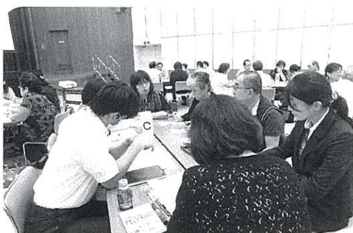
生活支援・介護予防を考える会