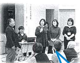
南部・山国のお宝を発表し、支え合いの本質を深めました！