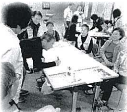
【お宝に興味づけしよう！】