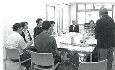
運営委員会のようす

この委員会は、ボランティア活動や市民活動の推進に関わる事業について、さまざまな立場からご意見をいただき運営に反映させることで、市民に開かれたボランティア・市民活動センターづくりを目指すことを目的としています。今年度は9月と1月の2回開催され、当日は和やかな雰囲気の中、ボランティア講座やボランティアの登録方法、情報紙などについて意見交換を行いました。今後も率直なご意見を頂き、更なる事業の発展に努めたいと思います。