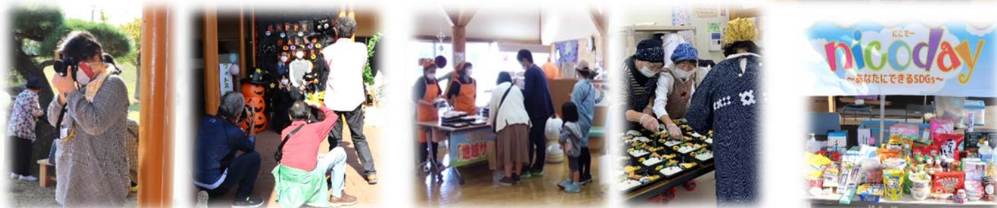
中津ボランティアカメラマンの会の皆さんに館内の撮影をお願いしました。