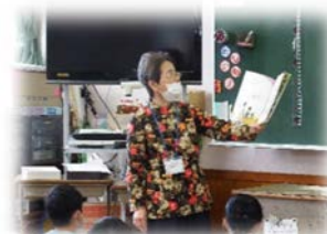
朝8時30分から約10分間、各クラスで本を読みます