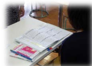
終わった後は図書室で読んだ本の記録と情報交換