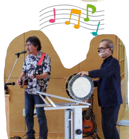
「沖代すずめ出前演芸部」より、三線や ギターの弾き語りと、手品を披露♪

出かけなくなると刺激が減って、 体も脳みそも衰えていきますよ。 地域の皆さんの体のこと、心のこ とを考えると、人と出会えるサロ ンやボランティア活動はとても大 事な取り組みです。時間を短くす るとか密集を避けるとか、コロナ を“正しく”恐れながらも自信を 持って活動を続けましょ～。