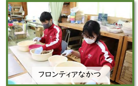
フロンティアなかつ