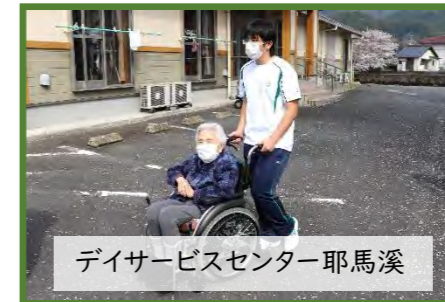
デイサービスセンター耶馬溪