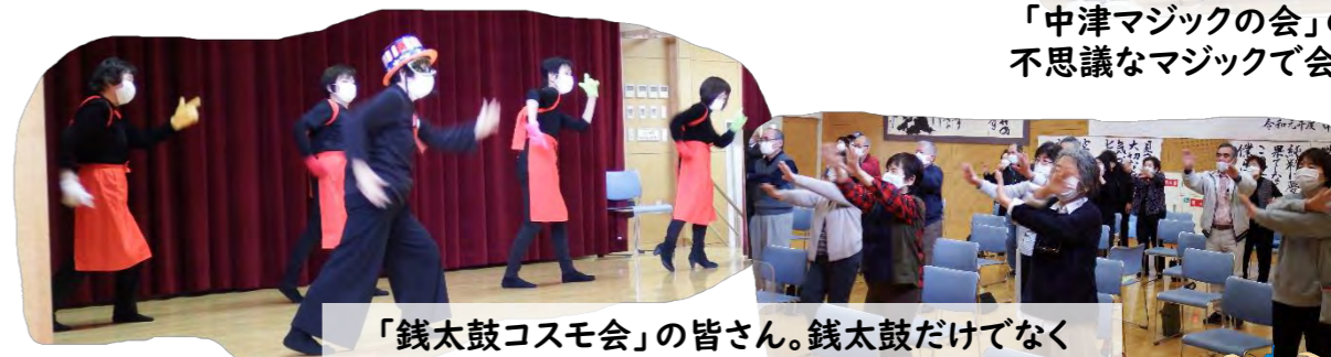
「銭太鼓コスモ会」の皆さん。銭太鼓だけでなく オリジナルの体操で皆さんも笑顔に!!