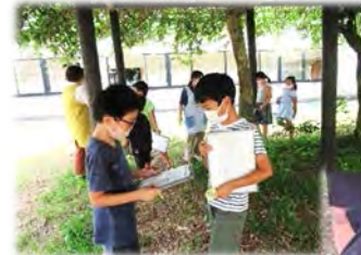
ネイチャーゲーム

まだまだ残暑(ざんしょ)きびしい日々。 夏バテしている人はいませんか? 新しい生活習慣の中で、2学期も元気に遊びましょう!