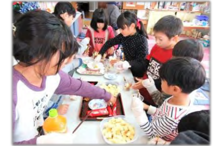
クリスマスパーティ ゲームとケーキとプレゼント♪