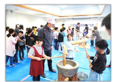
児童館のおもちつき キネでつくったおちはおいしい物!