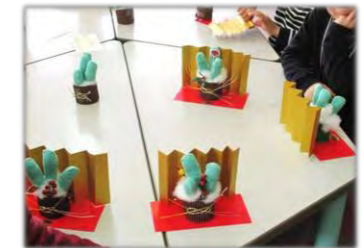
お正月準備OK! (軍手)でかまづき作り