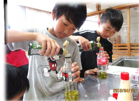
◇非常食体験:ピザ作り◇