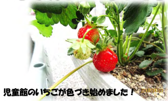
児童館のいちごが色づき始めました！

新しい芽から若葉となるこの季節、 心のびやかに、何か始まる予感が... さわやかな風の中、元気に 遊びましょう！