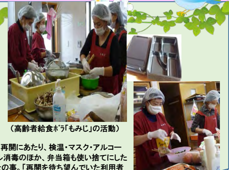
（高齢者給食ボラ「もみじ」の活動）

再開にあたり、検温・マスク・アルコール消毒のほか、弁当箱も使い捨てにしたとの事。「再開を待ち望んでいた利用者の方の笑顔を見れてうれしいです」と話していました。