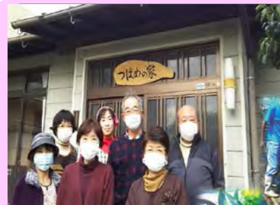
（サロン「つばめの家」）

市民病院そばの空き家を利用し、地域の高齢者を対象に、10月よりサロンを開始しました。健康体操・食事のあとは、脳トレ等回により異なる内容で楽しんでもらい、共に支えあうの精神で利用者の方に寄りそいながら、月4回活動しています。サロンで畑も作り育った野菜を食材にしています。