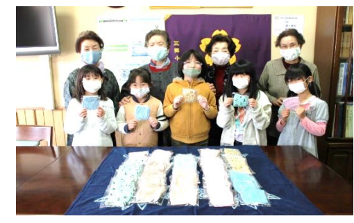
三郷小学校、カラフルマスクでチ～ズ