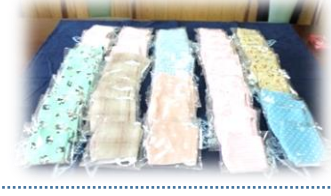
心のこもった手作りマスク