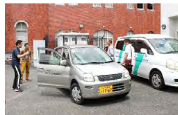
デイサービスで説明