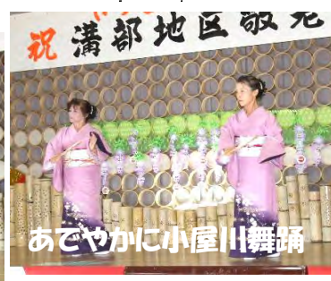
あでやかに小屋川舞踊