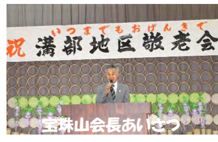
宝珠山会長あいさつ