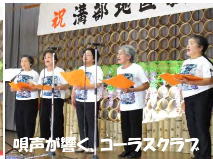
唄声が響く、コーラスクラブ