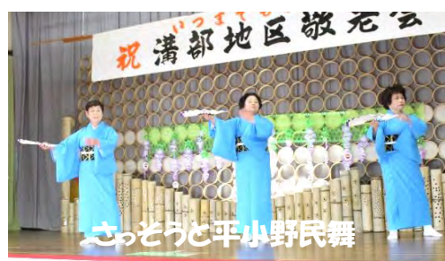
さっそうと平小野民舞