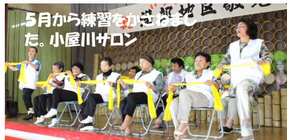
5月から練習をかさねました。小屋川サロン