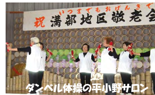
ダンベル体操の平小野サロン