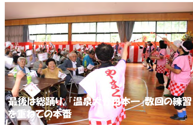
最後は総踊り、「温泉六本一」数回の練習を重ねての本番