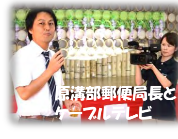
京溝部郵便局長とケーブルテレビ