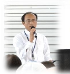
総評の草野総務・住民課長