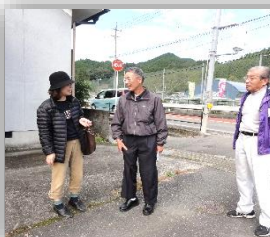
宇曾での声かけ。どちらにお出かけですか～