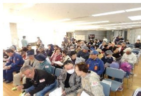
隣の方と声かけの練習をしています