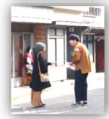
守実では子どもさんも声かけ体験