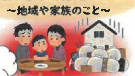
～地域や家族のこと～