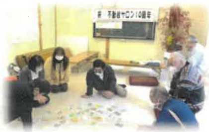
耶馬溪ご当地カルタをしました！