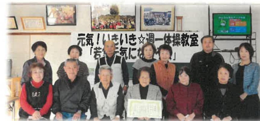
若宮週一体操 4周年おめでとうございます!!