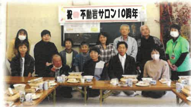
皆さんで記念撮影