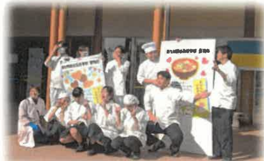
元気いっばいの龍谷高校食物科の皆さん😊