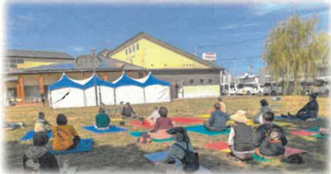
青空の下でパークヨガ