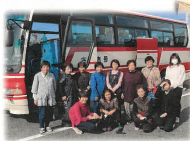
バスの前でパチリ🎉🎉