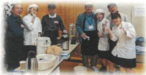
男塾の珈琲と龍谷高校食物科のクッキーコーナー

11月6日、中津市教育福祉センターで「シン・みんなのふくしまつり」を開催しました。当日は天候にも恵まれて約400人のお客さまにご来場いただきました。ステージではジャズやバイオリンの演奏が行われ、芝生の上ではパークヨガが行われました。他にも会場の様々な場所でワークショップや、イベントコーナーを設け、皆さまに楽しんでいただきました😊