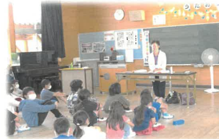
磯村さんの話に興味を持っていました◎