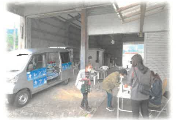
オレンジ号で出張します☺