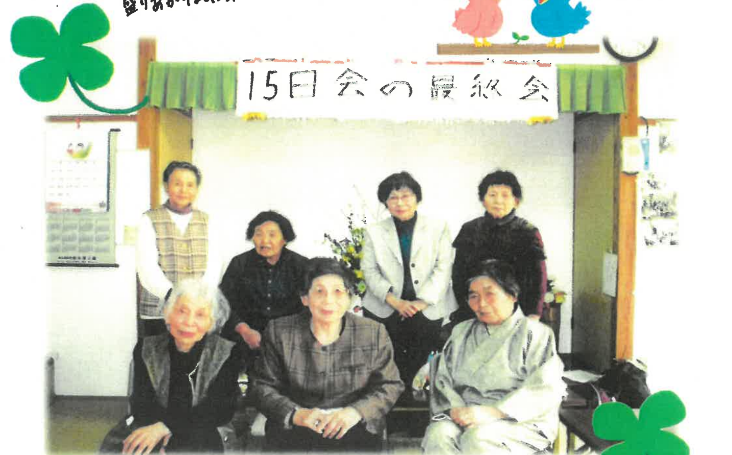
皆さんで記念撮影