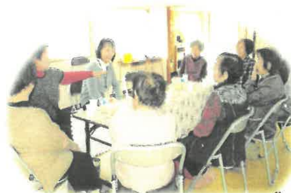
シニアほっと元気station「よりあ」