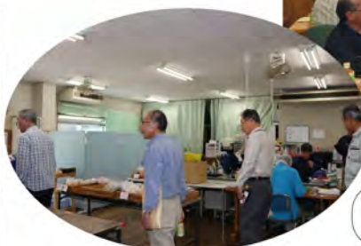
就労継続支援B型事業見学