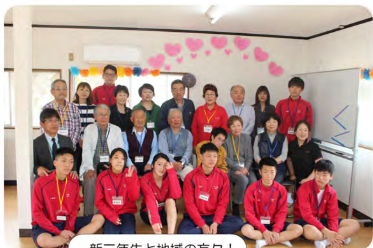
新三年生と地域の方々！

今後の予定 7/3(水) 10:45~ 9/11(水) 10:45~ 10/23(水) 10:45~