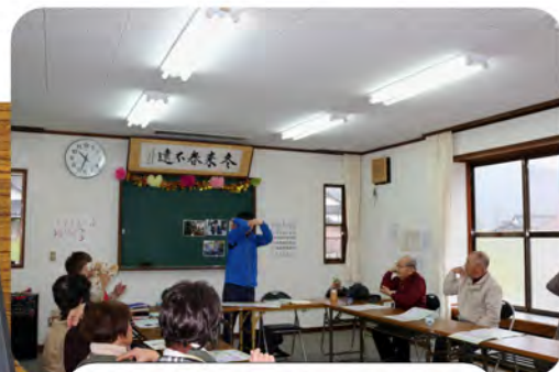
運動指導士と介護予防体操！

昨年秋に立ち上がった新しいサロンです。皆さん、積極的に参加し、活動しています！！