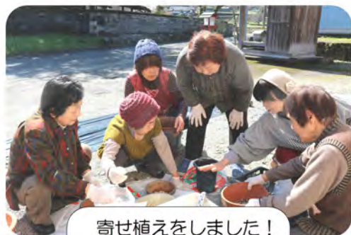
寄せ植えをしました！

お話好きな方が多く、明るく楽しいサロンです！ 見た目もきれいな毎回手作りのお昼御飯が並びます。