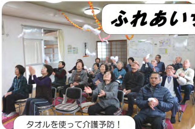
タオルを使って介護予防！