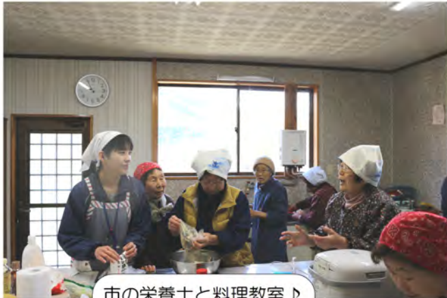
市の栄養士と料理教室♪