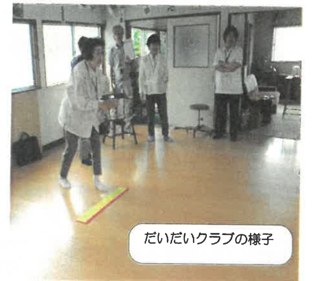
だいたいクラブの様子