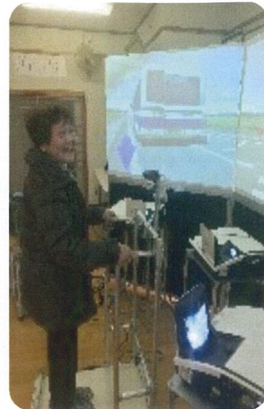
大分県警から講師をお招きして大きなスクリーンを使いながら交通安全講習をしました。 (下深水サロン)

そして、三光地区内でも、「ふれあいいきいきサロン」をはじめ、地区の防災訓練や「オレンジカフェ」など様々な催しが開催されました。