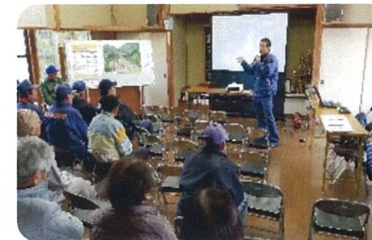
土田地区で防災訓練を実施して、たくさんの人が参加しました。日頃からの心構えが必要だという事がとても良くわかる内容でした。