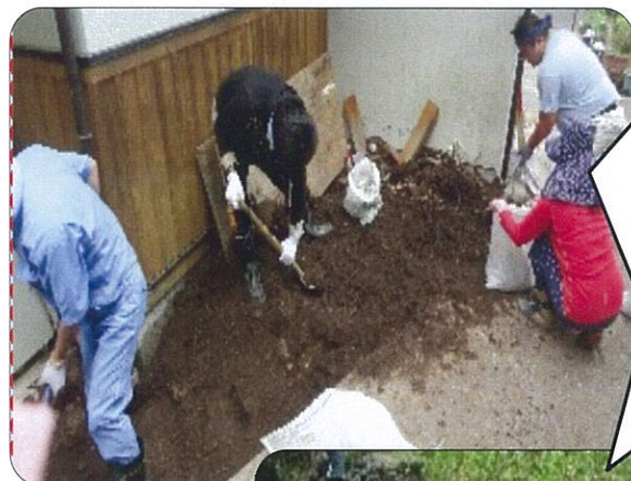
7月の豪雨で被害を受けた中津市。たくさんのボランティアさんが復旧支援の為に活動してくれました。