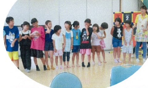
オレンジカフェ三光にはたくさんのお友達が来てくれて、みんなで一緒に認知症について勉強しました。