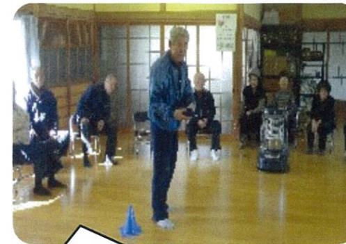
スポーツ大会が開催され、2種類のゲームで得点を競いました。優勝者には豪華賞品がありました。 (西秣サロン)