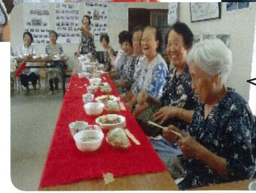
年に一度のお茶会です。駐在さんも来てくれて、楽しい時間になりました。 (下田口サロン)