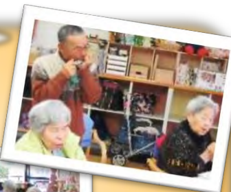
小袋様ハーモニカ演奏