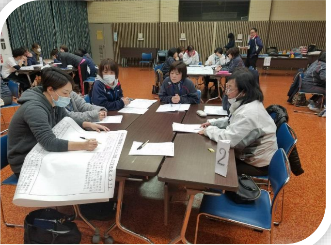
事例を基にしたグループワーク